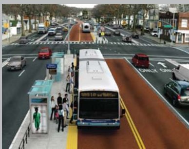
Ejemplo de Nueva York