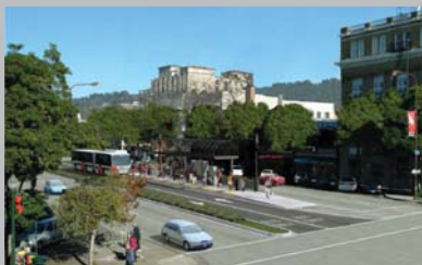
Ejemplo de California